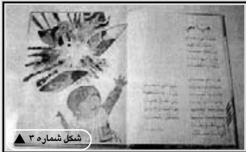
شکل شماره ۳ ▲

می‌شود و هر کس الگوی مورد نیاز و علاقه خود را می‌جوید، در نتیجه، به یک دستگاه الگوساز یا به تعبیر جورج اورول، وزارت حقیقت و یک شهزاد ساختگی نیاز نیست. در حالی که رژیم عراق مجبور بود از بالا و با استفاده از نهادها و تشکیلاتی چند، برای برانگیختن توده‌ها اقدام کند، ایران تحت تأثیر انقلاب توده‌ای و نیز باز تفسیر عناصری از فرهنگ شیعی خود، به صورتی طبیعی و از پایین عمل می‌کرد. ۳۷