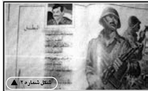
شکل شماره ۲ ▲

۴. ماکس وبر؛ اقتصاد و جامعه؛ ترجمه عباس منوچهری؛ مهرداد ترابی نژاد و مصطفی عمادزاده؛ تهران: انتشارات مولی، ۱۳۷۴، ص ۳۹۹. ۵. کسب جایگاهی مناسب در تاریخ و سربلندی در برابر آیندگان یکی از دغدغه‌های طبیعی سیاستمداران و دولتمردان هر کشوری است؛ برای نمونه، طی جلسه پرسش و پاسخی که با یکی از دولتمردان ایرانی برگزار شد، وی در دفاع از مطلب خاصی، به طور مکرر بر این نکته تأکید کرد که ما در برابر تاریخ مسئول هستیم و باید پاسخ‌گوی آیندگان باشیم. نکته